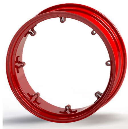
Roue à Pontets