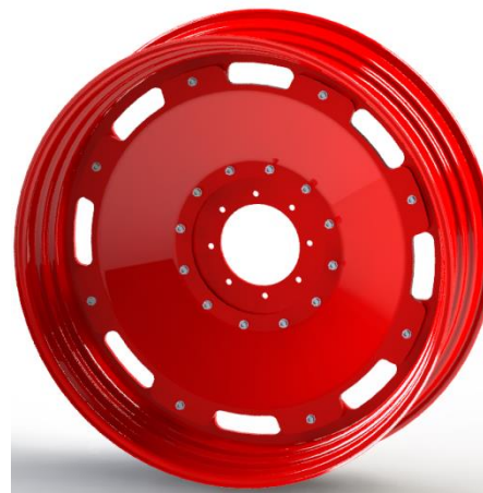
Roue à voie variable avec centre amovible