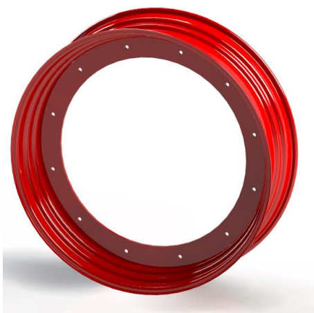
Roue à Couronne soudée