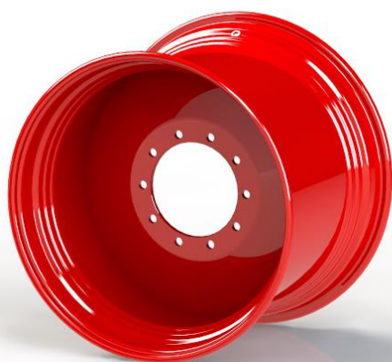
Roue monobloc à voie fixe